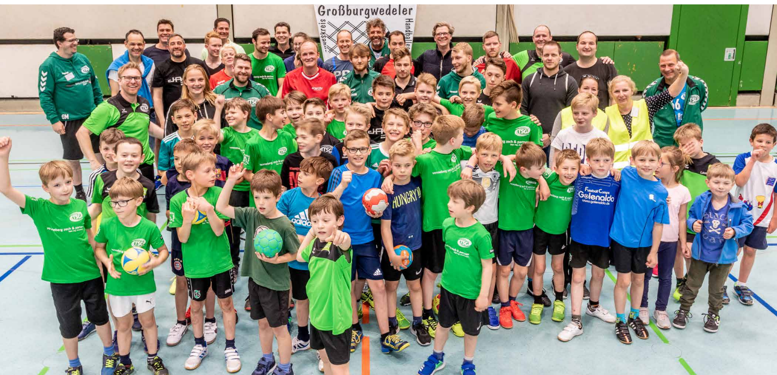
Viel zu lange her... Klein und Groß beim letzten Saisonabschlussfest der Handballer im Mai 2019