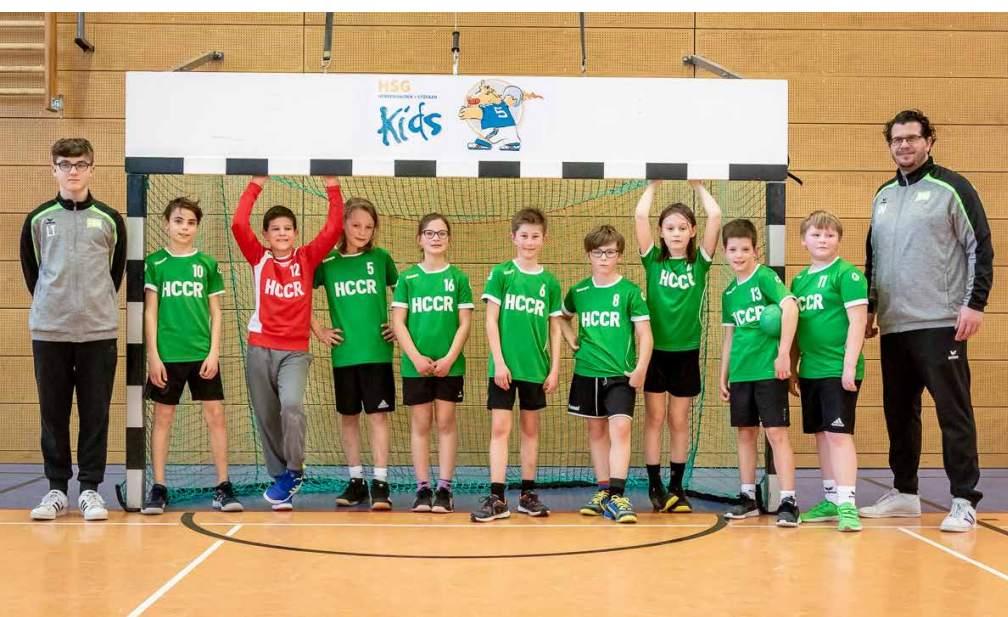
Das Team nach dem erfolgreichen Auswärtsspiel bei der HSG Herrenhausen/Stöcken