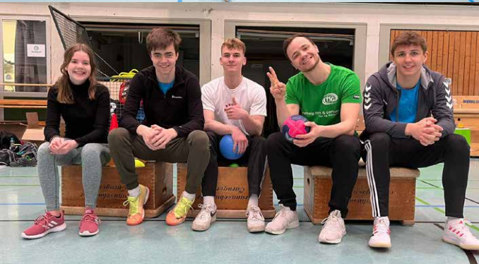
Alle Teilnehmer und auch die Betreuer hatten viel Spaß während der 5 Camp-Tage.